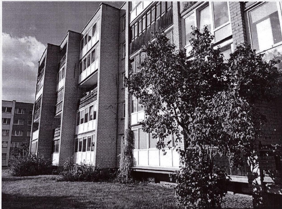
Pastato (jo dalies) fotonuotrauka

Pastatų energinio naudingumo sertifikavimo ekspertas