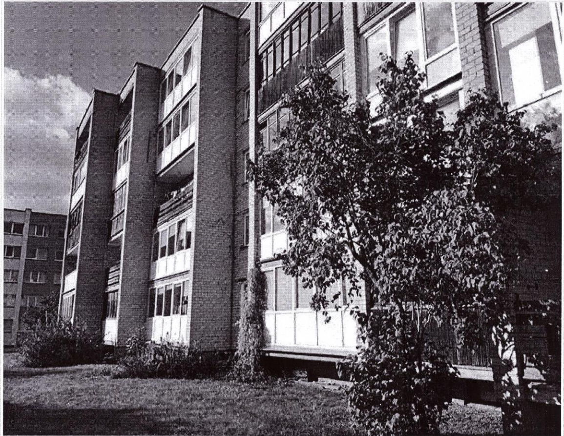
Pastato (jo dalies) fotonuotrauka

Pastatų energinio naudingumo sertifikavimo ekspertas