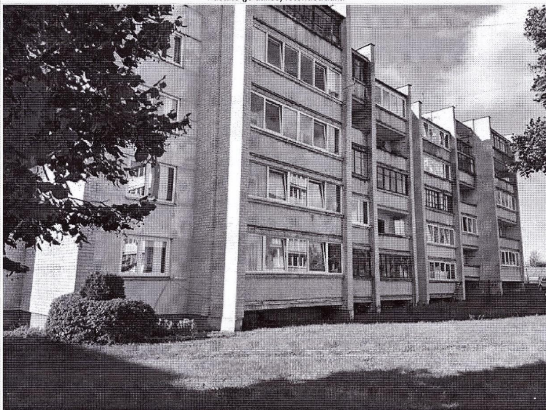
Pastato (jo dalies) fotonuotrauka

Pastatų energinio naudingumo sertifikavimo ekspertas