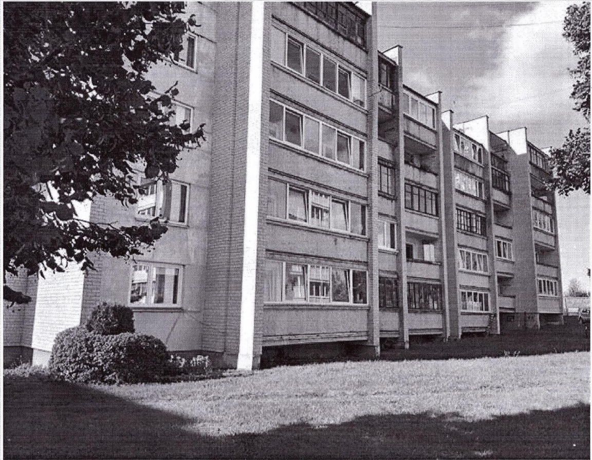
Pastato (jo dalies) fotonuotrauka

Pastatų energinio naudingumo sertifikavimo ekspertas