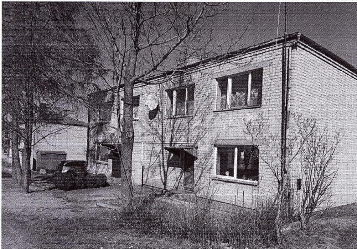
Pastato (jo dalies) fotonuotrauka

Pastatų energinio naudingumo sertifikavimo ekspertas