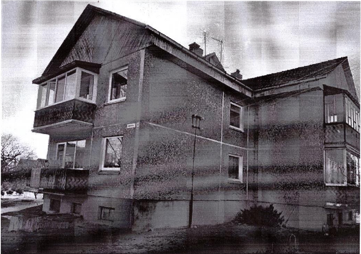
Pastato (jo dalies) fotonuotrauka

Pastatų energinio naudingumo sertifikavimo ekspertas