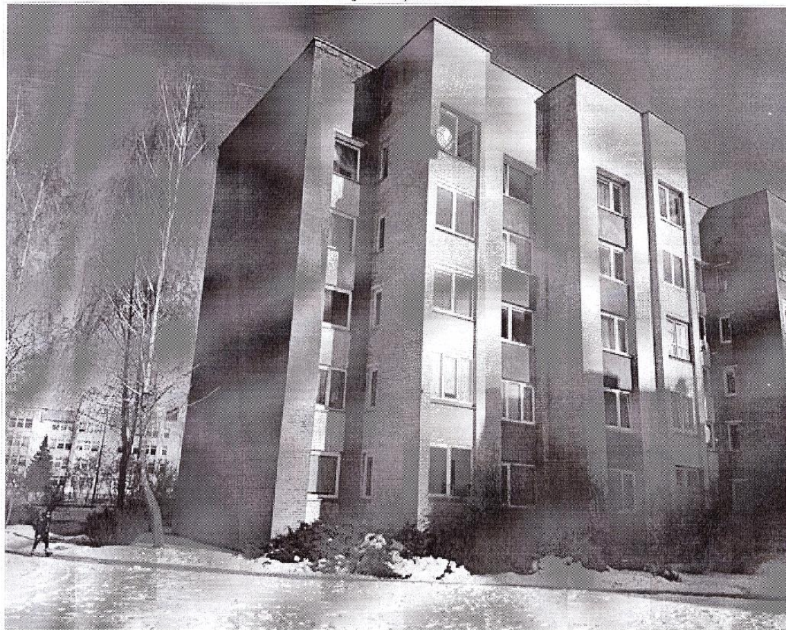
Pastato (jo dalies) fotonuotrauka

Pastatų energinio naudingumo sertifikavimo ekspertas